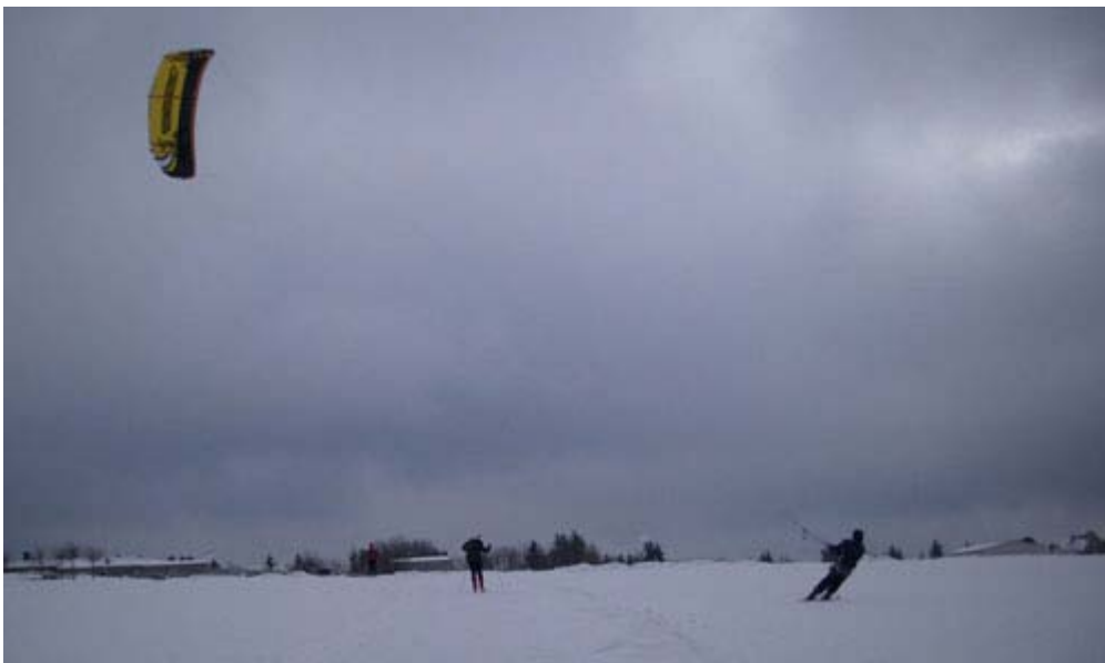
Ski-Kiter vor Neustadt am Rennsteig

– der 100 km Lauf war vergangenes Jahr seine Idee, er hat auch den zweiten organisiert, unterstützt vom Autor – Stadtverwaltung Waltershausen).