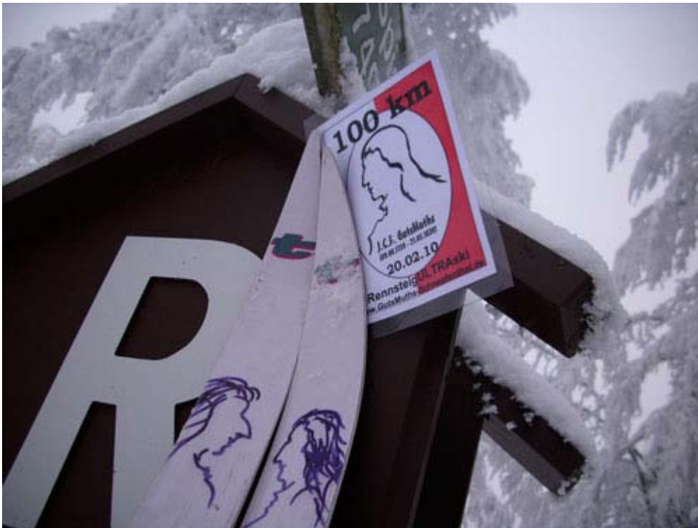
Starter-Kärtchen und Training-Ski des Autors mit Vorbildern Salzman und GutsMuths Es folgen zwei Bilder vom verschneiten Rennsteig im Januar 2010. Wollen wir hoffen, dass es hier in einem Jahr genauso verwunschen aussieht!