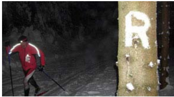
R-Ultraläufer nach dem start auf dem Sperrhügel

Alle Teilnehmer erhielten Urkunden, GutsMuths-Zeitschriften und Info-Blätter.